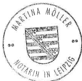
M ö l l e r / Notarin